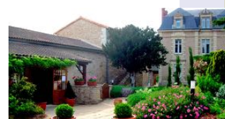
Le Logis de Pompois nous accueille en 2019