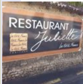
La Petite France, au restaurant chez Juliette