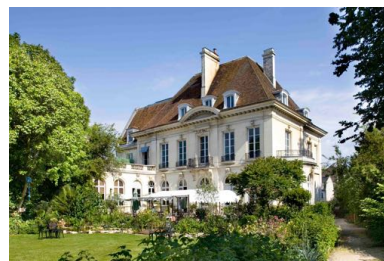
La Gourmandine nous recevra en 2019